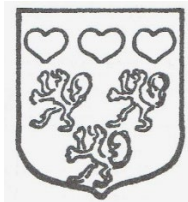
Wapen van Joos de Clerck, schepen van Opwijk (einde 16e eeuw), volgens zerk in de kerk van Merchtem. (Jan Lindemans, Geschiedenis van Opwijk, 1937, blz. 277).