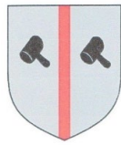
van den Broecke